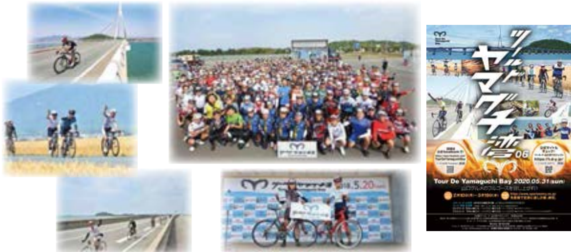
自転車を活用したスポーツイベント開催事例（ツール・ド・山口湾）