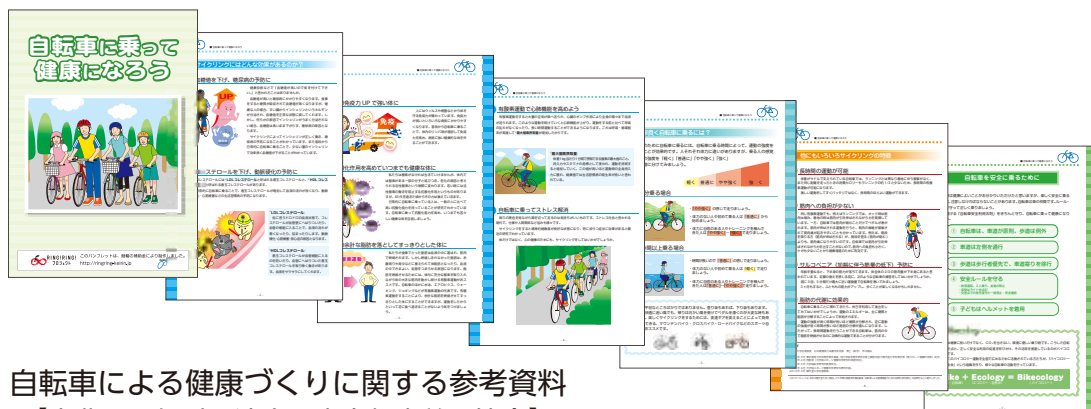
自転車による健康づくりに関する参考資料