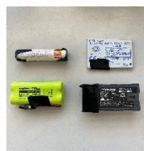
充電式電池の出し方（例）

取り外した充電式電池は、電極にテープを貼り、市役所本庁舎・各ふれあいセンターなどに設置してある黄色いリサイクルボックスへ入れてください。