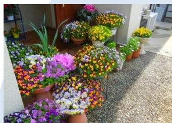
花はきれいに♪ 野菜も大きく♪