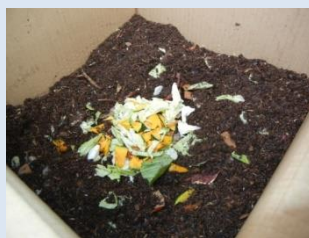
箱の中に 生ごみを投入！

制度の詳細は、宇部市公式ウェブサイト（ウェブ番号1002039）をご覧ください。 （右の二次元バーコードからもアクセスが可能です。）