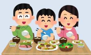
調理・食事をすると…