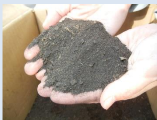
良質な肥料に変身！