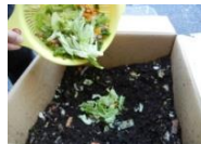
生ごみを投入し、混ぜる