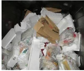
発泡スチロール（廃プラ）

事業活動で排出されたプラスチックやビニール等は産業廃棄物となります。近年、事業系一般廃棄物と産業廃棄物が混在しているケースが多く確認されています。