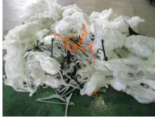
ストレッチフィルム、 衣料品店のハンガー（廃プラ）