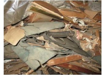
建築工事等に伴って生じる 木くず・紙くず