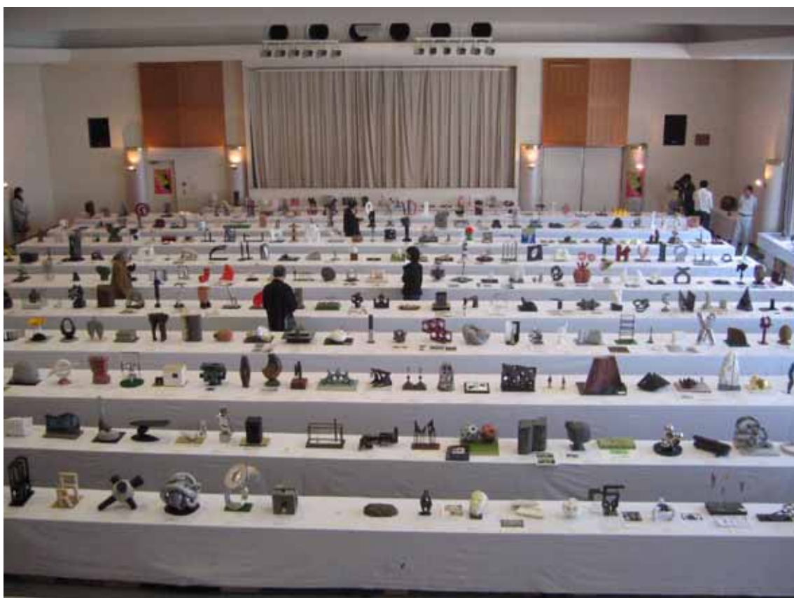
第 23 回 UBE ビエンナーレの模型選考の様子