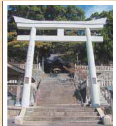
2 横瀬八幡宮 (上小野)