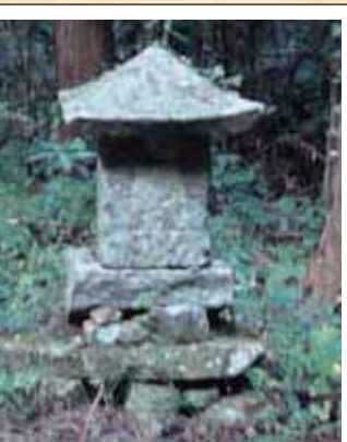
3 竜神社(水神社) (美保)