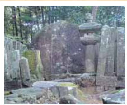
1 桂就政の墓 (阿武瀬)