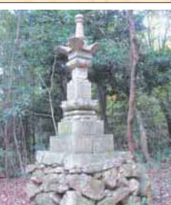
6 宝篋印塔 (椋小野)