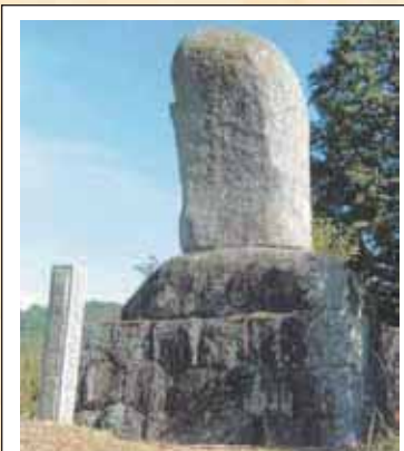
2 志賀親次の墓 (上宇内)