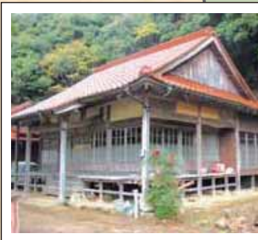
8 古跡臨濟宗如意寺 (如意寺)