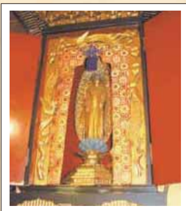
1 阿弥陀堂 (上宇内)