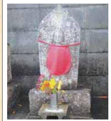
7 六十六部の墓 (白麻)