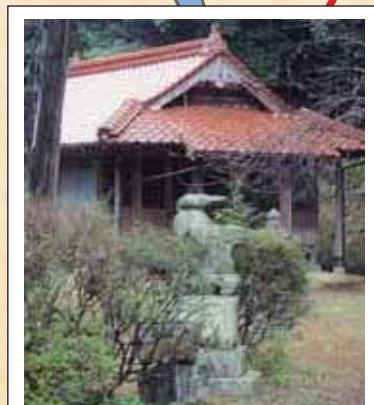
5 河内社 (一ノ坂)