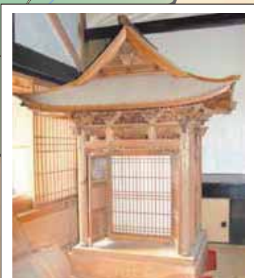
5 法泉寺厨子 (椋小野)