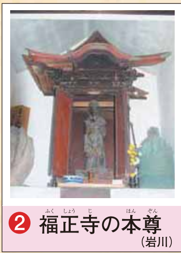
2 福正寺の本尊 (岩川)