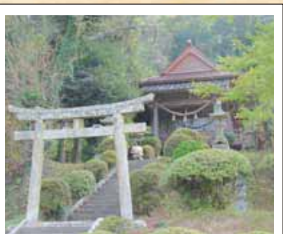
4 武内神社 (椋小野)