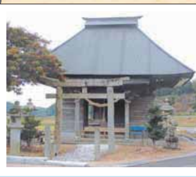
1 大歳神社 (市小野)