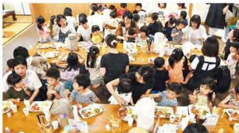
『みんなや食堂』の様子