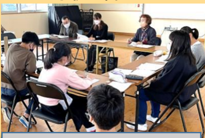
学校運営協議会への児童参加